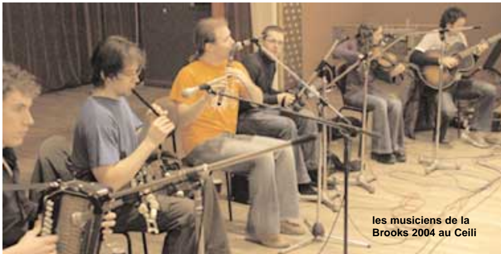
les musiciens de la Brooks 2004 au Ceili